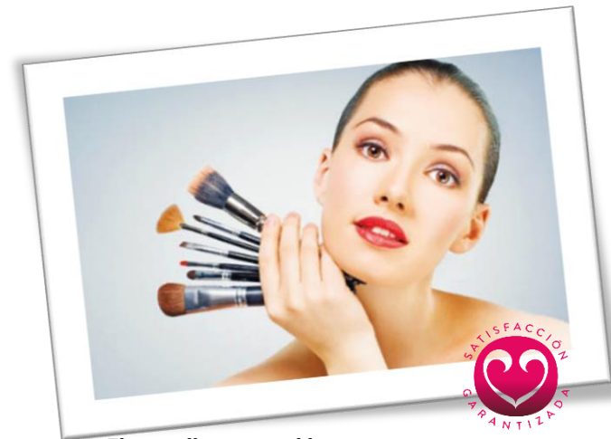
El maquillaje impecable

No olvides incluir a tus amigas o familiares . Nuestro servicio se extiende a ellas también Cuidamos de todas la invitadas para que solo te preocupes por lo necesario .Para ello hemos creado un servicio único y especial llamado BEAUTY CORNER . Quedarás como una excelente anfitriona.